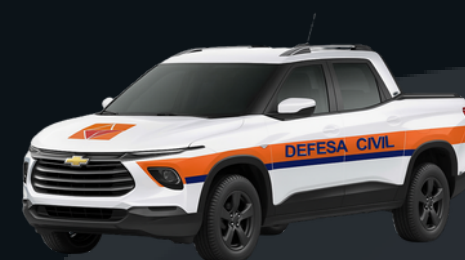
Caminhonete de Pequeno Porte

Deslocamento nas ações de proteção e defesa civil