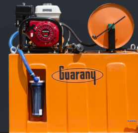
Kit com Tanque de Água

Permite combate direto e autônomo em campo