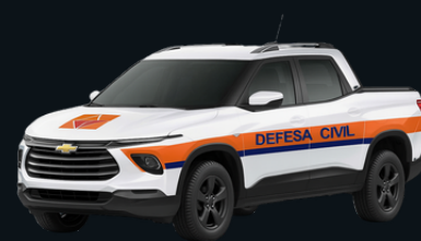
Caminhonete de Pequeno Porte

Deslocamento nas ações de proteção e defesa civil