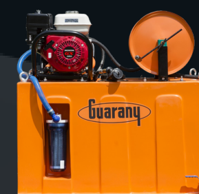
Kit com Tanque de Água

Permite combate direto e autônomo em campo