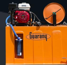
Kit com Tanque de Água

Permite combate direto e autônomo em campo