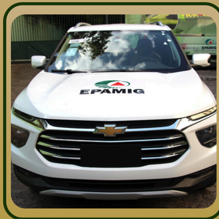
MONTANA T AT LTZ