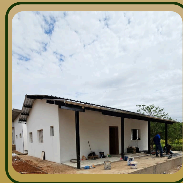
LABORATÓRIO DE ENTOMOLOGIA (CESR)