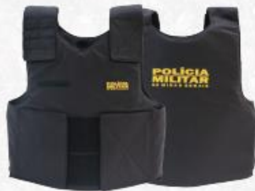
GND 3 - Custeio/Despesa corrente

O presente projeto objetiva a captação de recursos para aquisição de itens que ampliam a proteção do policial militar bem como minimizam os impactos do uso da força durante a atuação junto à sociedade, além de facilitar as comunicações operacionais e o atendimento das ocorrências policiais.