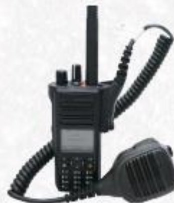
GND 4 - Capital/Investimento