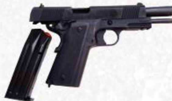
GND 4 - Capital/Investimento