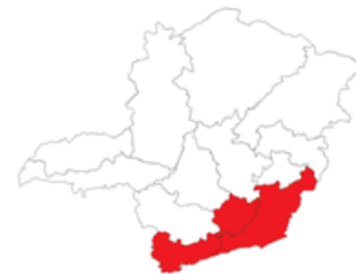
Regiões de Barbacena, Juiz de Fora e Pouso Alegre

Programa 102 – Fomento à economia da criatividade