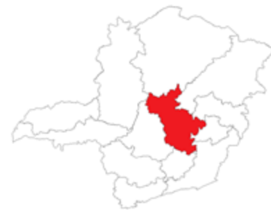
Região de BH

Ação 4332 - Apoio a projetos culturais e turísticos realizados por intermédio de parcerias