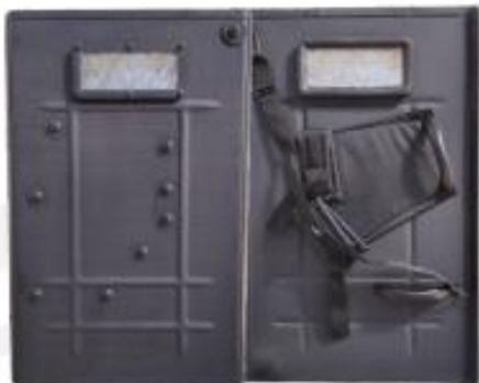
GND 4 - Capital/Investimento