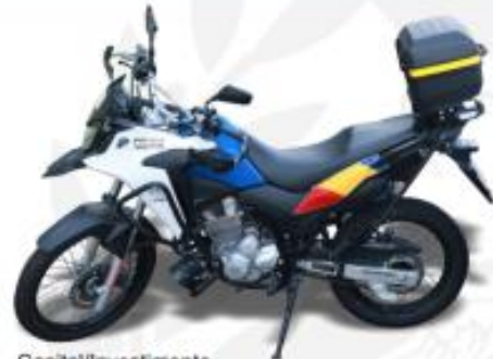
GND 4 - Capital/Investimento