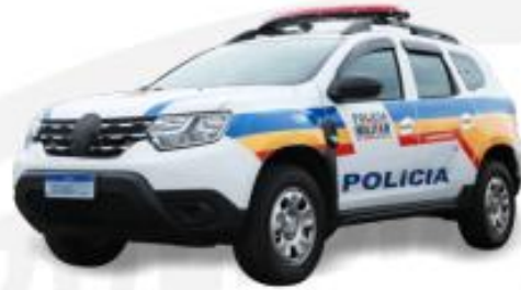
GND 4 - Capital/Investimento