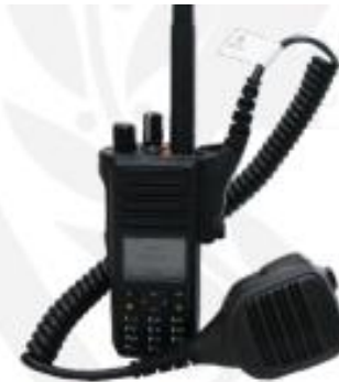
GND 4 - Capital/Investimento