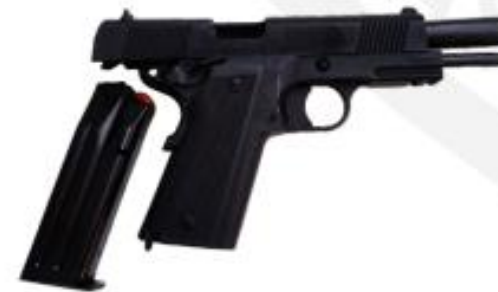
GND 4 - Capital/Investimento