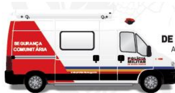
GND 4 - Capital/Investimento