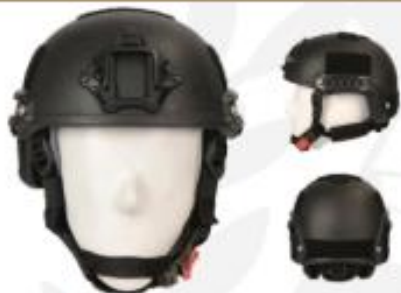
GND 4 - Capital/Investimento