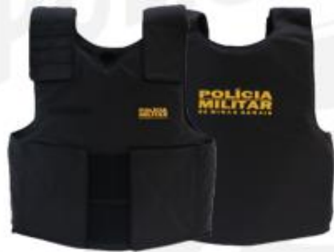
GND 3 - Custeio/Despesa corrente

O presente projeto objetiva a captação de recursos para aquisição de itens que ampliam a proteção do policial militar bem como minimizam os impactos do uso da força durante a atuação junto à sociedade, além de facilitar as comunicações operacionais e o atendimento das ocorrências policiais.